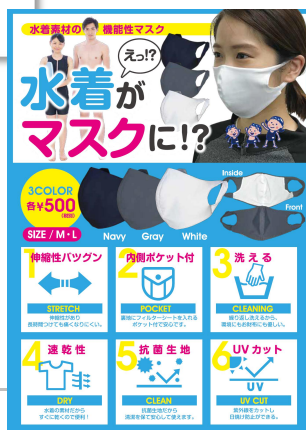
フィットネスメンバー7,000名に1人1枚、社員・スタッフには1人2枚を無償提供

新型コロナウイルスへの対応で奮闘する医療従事者向けにフィットネスのオンラインレッスンを無償提供しています。少しでもストレス解消、心身の健康の一助となればと、微力ながら取り組んでいます。