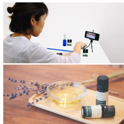
JEA 監修マイメディカルアロマスクール

さらに体験レッスンでは、ヨガ・ピラティスには筋膜グッズ、アロマにはリラックス精油 3本セットをプレゼント。気軽にスタートできるきっかけや本格的に学ぶ機会を提供し、心身ともに健康な毎日を応援していきます。