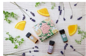
メディカルアロマ体験プレゼント （JEA 25周年記念特別リラックス 精油セット）