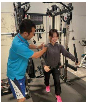
▲トレーナーマッチングによるパーソナルトレーニング

今回の取り組みでは、空きスペースを有効活用したいビルのオーナーや、ウェルネスツーリズムへの適応を検討するホテル、また、独立開業を志向するも高額投資が難しいトレーナーなど多様な潜在需要を見込んでいます。初年度に登録トレーナー数200名を目標としているトレーナーマッチングサイトは、利用者が質の高いトレーニングを受けられ、トレーナーの仕事機会をも増大するためのものです。フィットネス市場を再起動させるため、事業者と利用者、トレーナーの“三方良し”を模索して考案しました。